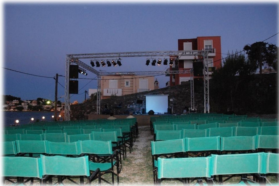
1.6 Ο χώρος των συναυλιών