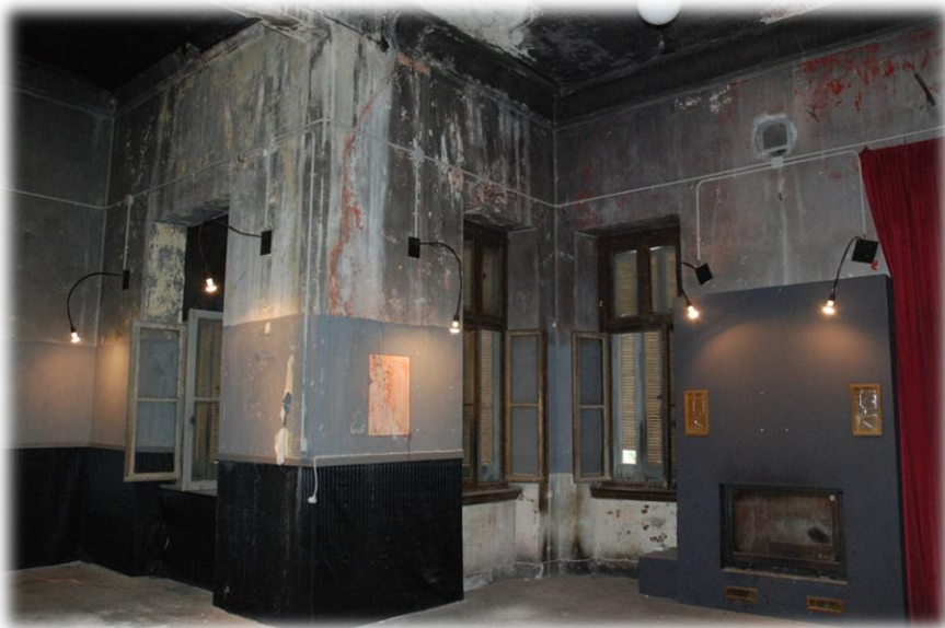
1.2 Εσωτερικό του κτιρίου 08/12/2010