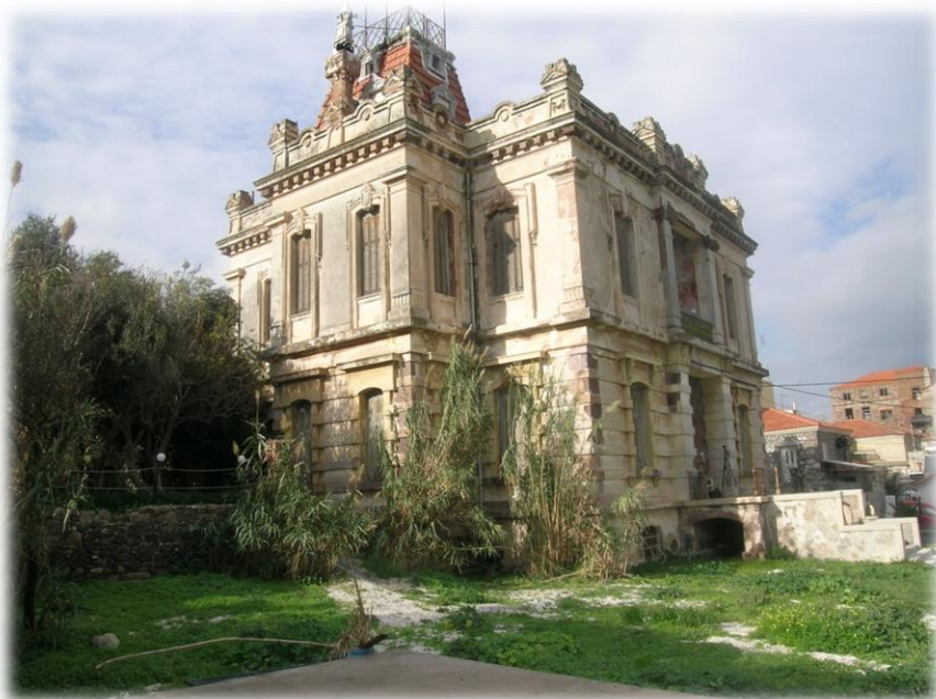
1.1 Το κτίριο