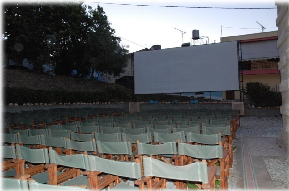
1.5 Ο χώρος του θερινού σινεμά