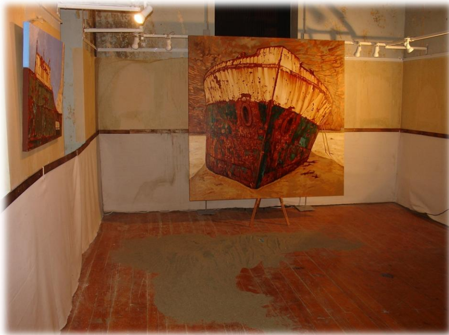
1.4 Έκθεση «το ναύαγιο» του Δημήτρη Καλαντζάκη (πάνω όροφος)