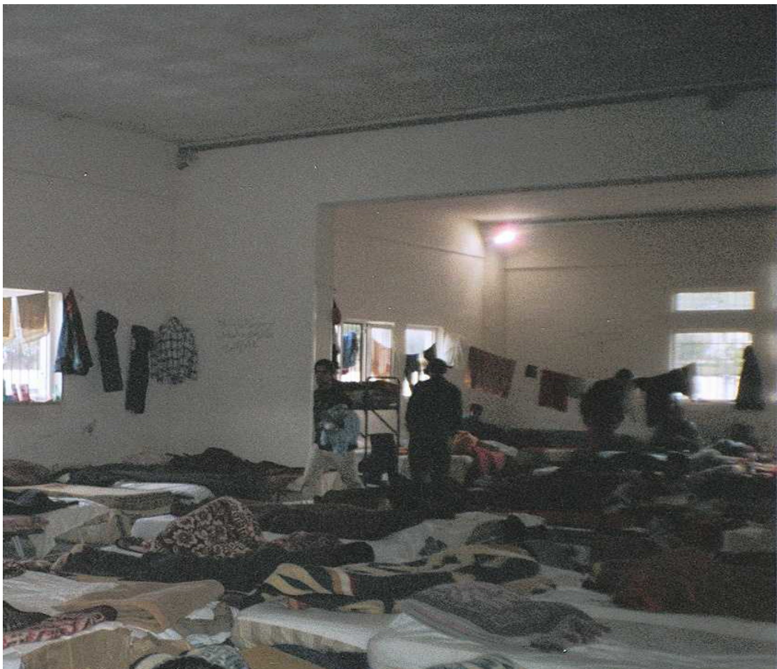
Εικόνα 4: Ένας από τους θαλάμους.