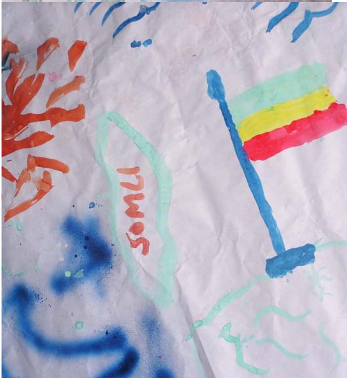
Εικόνα 7: Ερυθραία, στην κορυφή της Αιθιοπίας. Εικόνα 8: Σομαλία.