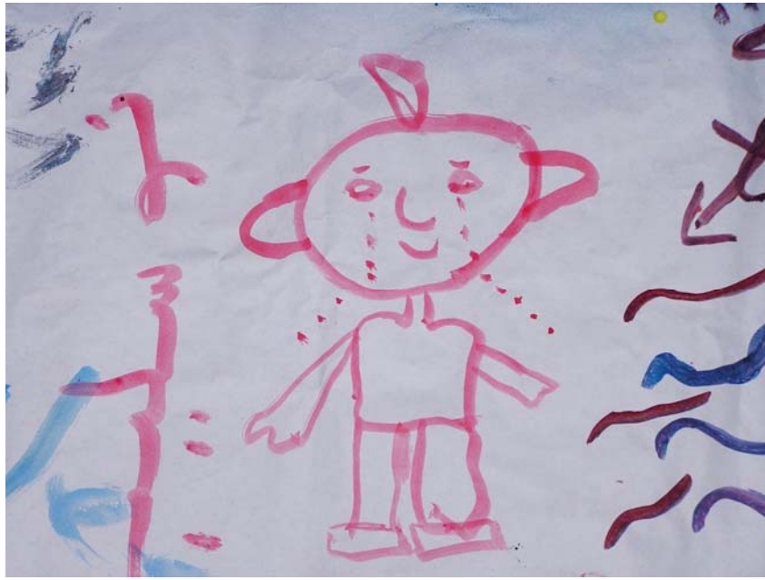
Εικόνα 9: Παράπονο για την αϋπνία. Δίπλα γράφεται στην αραβική “no sleep”.