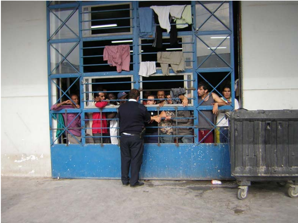
Εικόνα 3: Της φυλακής τα σίδερα...