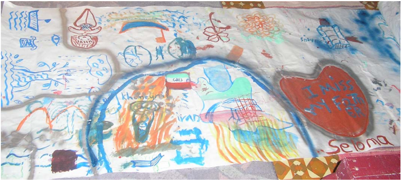
Εικόνα 1: Κάποια από τα σχέδια των γυναικών κατά τη διάρκεια ζωγραφικής