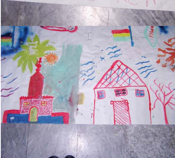
Εικόνα 5: My house..