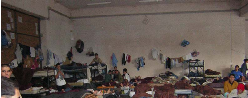
Εικόνα 5: Ένας ακόμη θάλαμος.