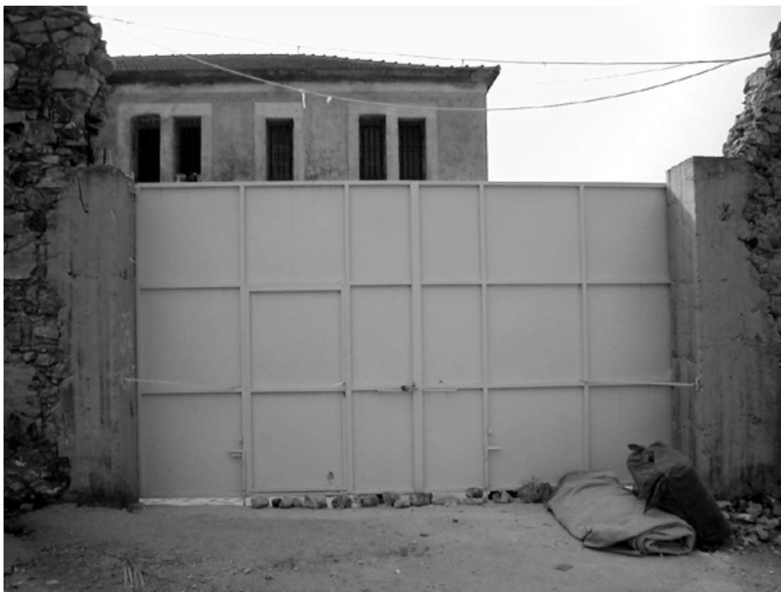
Εικόνα1: Είσοδος του Κέντρου Κράτησης όταν βρισκόταν στην περιοχή της Λαγκάδας