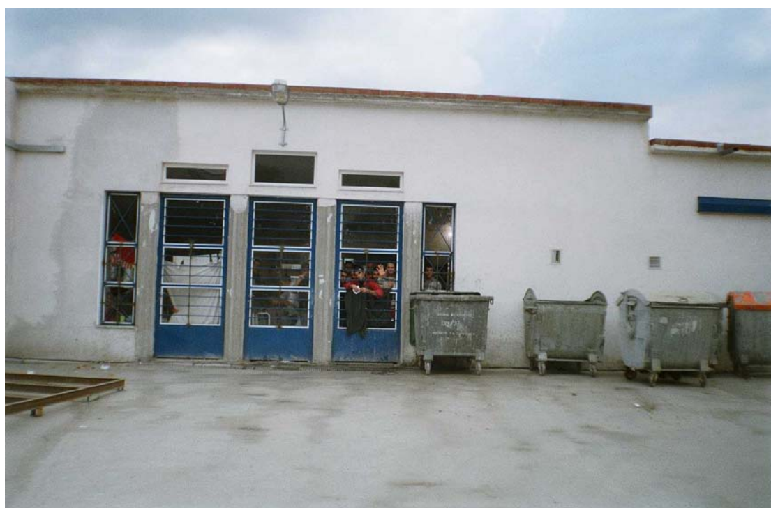
Εικόνα 2: Οι εξωτερικοί χώροι του Κέντρου Κράτησης στην Παγανή