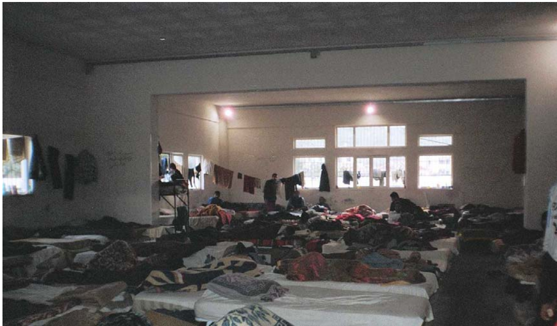
Εικόνα 6: Ράντσα στη γραμμή..