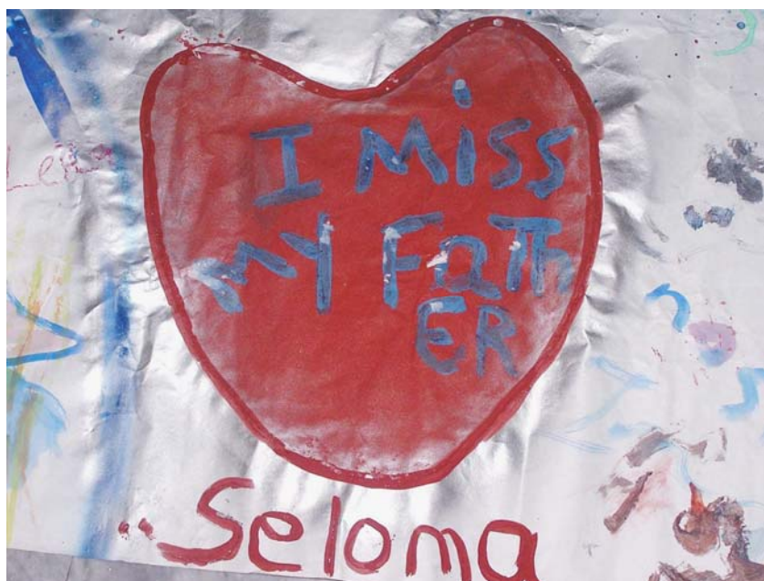
Εικόνα 4: I miss my father..