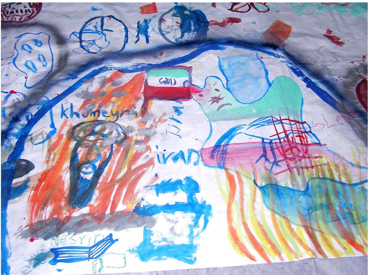
Εικόνα 2: Ο φλόγες..