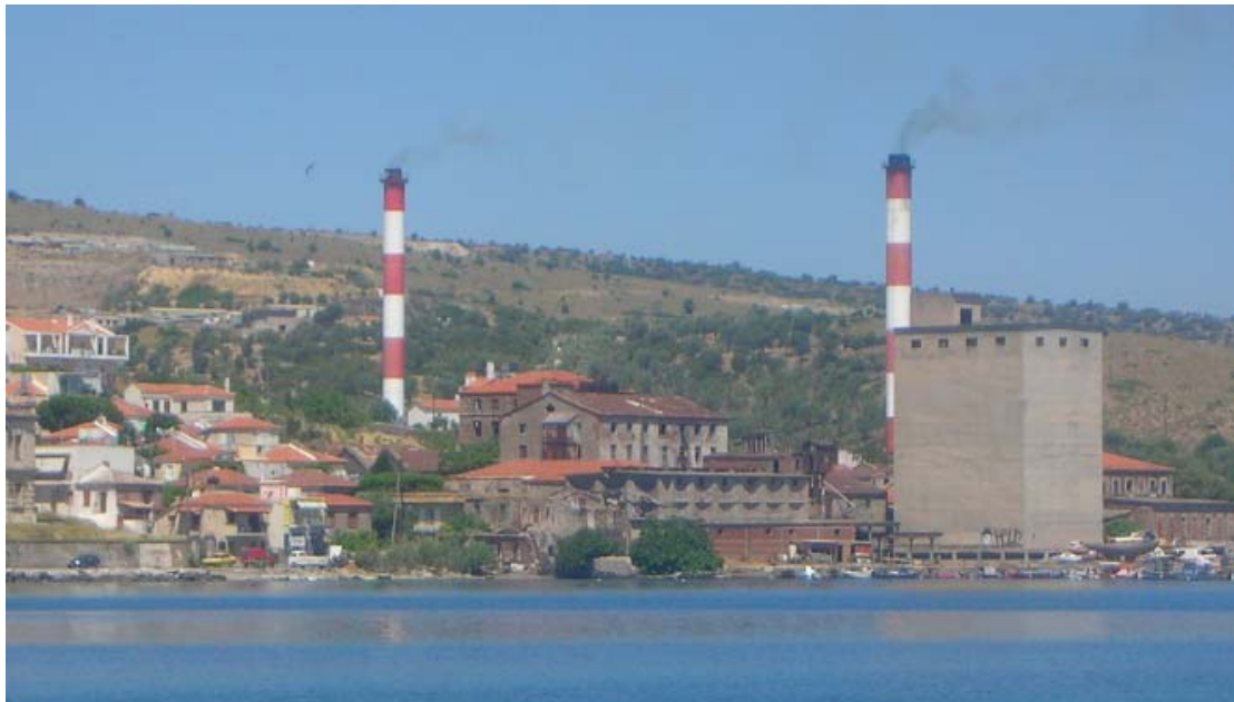
Εικόνα 5: Το 'Καλαμάρι'. (Πίσω του διακρίνεται το εργοστάσιο της ΔΕΗ.)

Στην περιοχή που οδηγεί και στην έξοδο της πόλης βρίσκεται το αρχοντικό του Γεωργιάδη, το οποίο μία εποχή στέγαζε το Στρατιωτικό Νοσοκομείο. Το 1880 ο Γεωργιάδης κτίζει ελαιοτριβείο και κυλινδρόμυλους, γίνεται ομόρρυθμος Εταιρεία και προστίθενται νηματουργείο, βαφείο, υφαντουργείο και μακαρονοποιεία. Το 1924 το παίρνει ο Καλαμάρης, εξού και το όνομα με το οποίο είναι γνωστή η περιοχή σήμερα (βλ. Εικόνα 5). Τότε ήταν η 20 η ανώνυμη εταιρεία σε πανελλήνια κατάταξη που το 1947 απασχολούσε 700 άτομα στις υπηρεσίες της (ο.π).