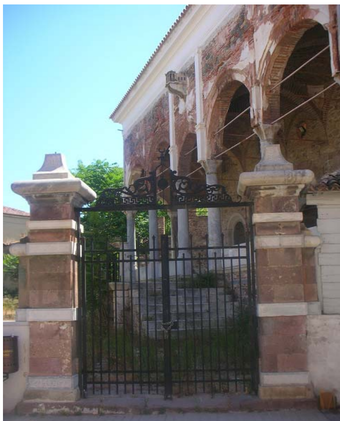
Εικόνα 1: Γενί Τζαμί

Στη σημερινή οδό Αδραμυττίου όπου ανηφορικά ο δρόμος βγάζει στο δρόμο του κάστρου, είναι σήμερα χτισμένα τα σπίτια της Επάνω Σκάλας. Λίγο βορειότερα του τζαμιού (στην οδό Ντικελί), είναι ένα σχολείο, το οποίο παλαιότερα στέγαζε το τούρκικο νοσοκομείο και στη συνέχεια, γύρω στο 1936, με την ανταλλαγή πληθυσμού, εγκαταστάθηκε εκεί το νοσοκομείο των προσφύγων.