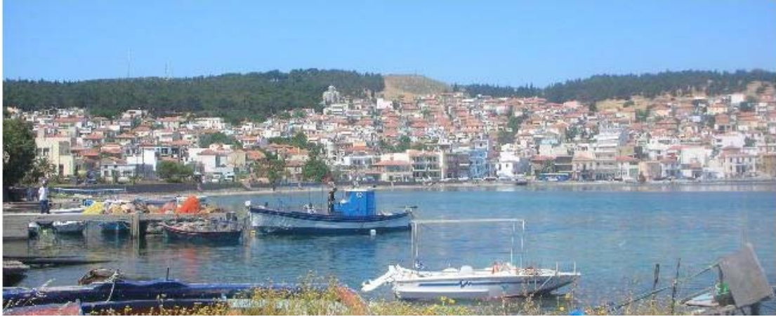
Εικόνα 4: Λιμάνι Επάνω Σκάλας

Στην περιοχή που οδηγεί και στην έξοδο της πόλης βρίσκεται το αρχοντικό του Γεωργιάδη, το οποίο μία εποχή στέγαζε το Στρατιωτικό Νοσοκομείο. Το 1880 ο Γεωργιάδης κτίζει ελαιοτριβείο και κυλινδρόμυλους, γίνεται ομόρρυθμος Εταιρεία και προστίθενται νηματουργείο, βαφείο, υφαντουργείο και μακαρονοποιεία. Το 1924 το παίρνει ο Καλαμάρης, εξού και το όνομα με το οποίο είναι γνωστή η περιοχή σήμερα (βλ. Εικόνα 5). Τότε ήταν η 20 η ανώνυμη εταιρεία σε πανελλήνια κατάταξη που το 1947 απασχολούσε 700 άτομα στις υπηρεσίες της (ο.π).