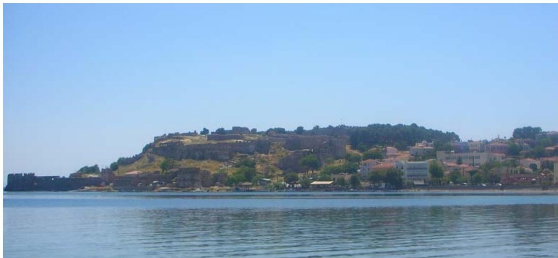
Εικόνα 3: Κάστρο Μυτιλήνης

εποχή του Ιουστινιανού, στη συνέχεια ενισχύθηκε το 1373 από τον Γενοβέζο Φραγκίσκο Γατελούζο και συμπληρώθηκε στα χρόνια της τουρκοκρατίας (Τουριστική Μυτιλήνη, 2004).