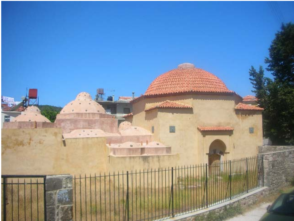
Εικόνα 2: Τούρκικο Λουτρό

Στην οδό Καραβαγγέλη συναντάμε το σημερινό 8 ο δημοτικό σχολείο, στου οποίου τη θέση ήταν κτισμένο το κονάκι του Ισμαήλ πασά Κουλαξίδη με χαρακτηριστικό του τον τεράστιο σε έκταση κήπο του που έφθανε μέχρι το λουτρό της αγοράς, κτίριο το οποίο το 1912 στέγασε τμήμα του ελληνικού στρατού (ο.π).