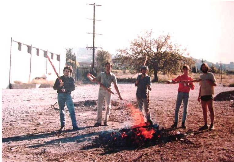
Προετοιμασία για τη γιορτή