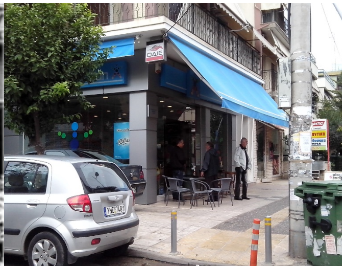
Εικόνα 1. Το πρακτορείο Ο.Π.Α.Π. την εποχή του Malaby (1996-9). Εικόνα 2. Το σύγχρονο πρακτορείο του Ο.Π.Α.Π. (2014).

Ο συγγραφέας εξηγεί αυτή την πρακτική ως απορρέουσα της σχεδόν ανύπαρκτης κοινωνικοποίησης που παρατήρησε στα κρατικά πρακτορεία. Μια προσπάθεια των ιδιοκτητών να ζεστάνουν με πολύχρωμες αφίσες το παγερό εσωτερικό τους και παράλληλα να διαφημίσουν περισσότερο τις υπηρεσίες που προσφέρουν οι χώροι διενέργειας του νόμιμου παιχνιδιού (Malaby, 2003:107).