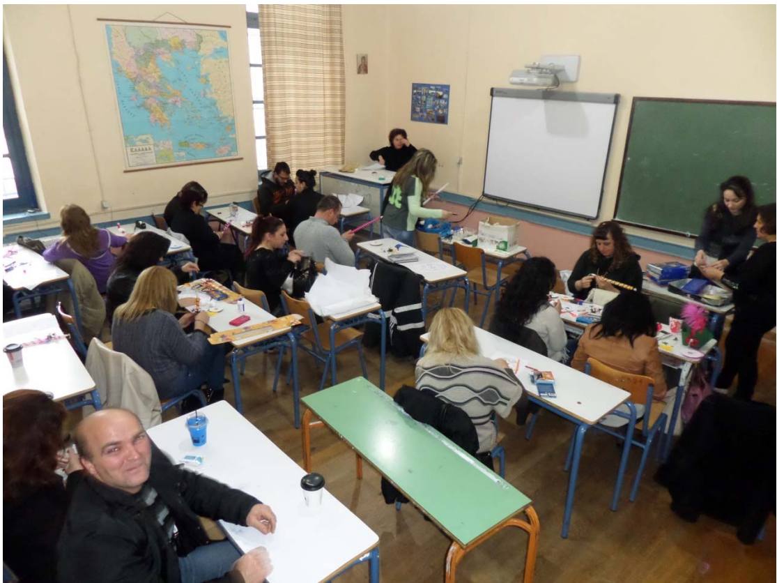
Εικ.5 : Εργαστήρι Λαμπάδας για το Πάσχα