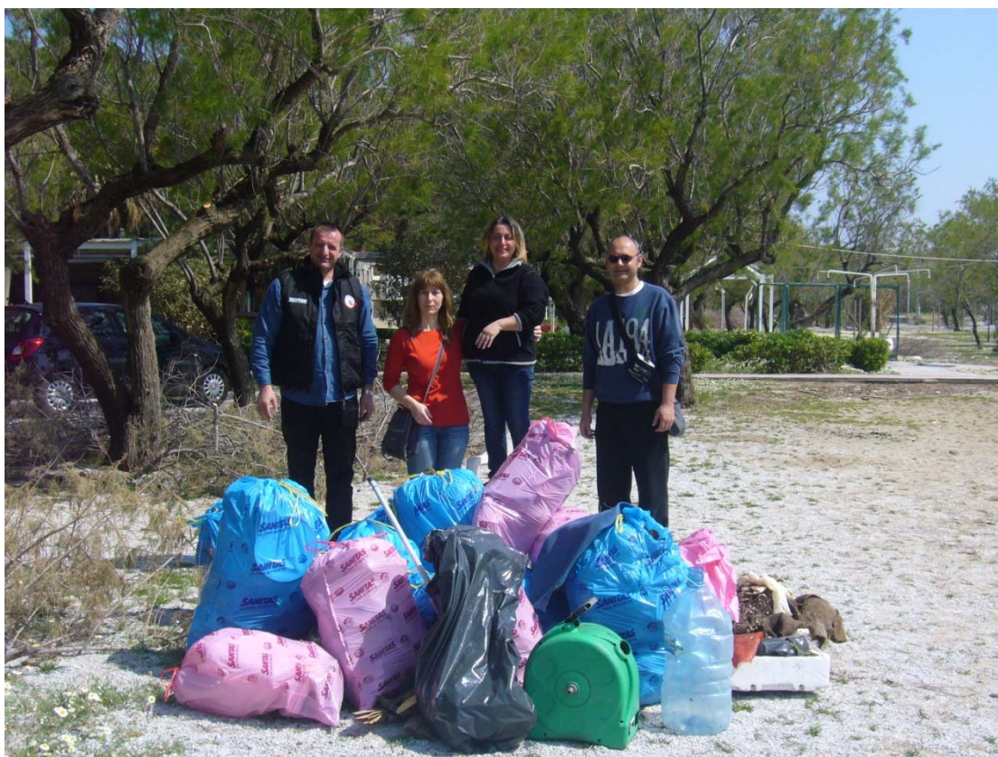
Εικ.6: Συμμετοχή του ΣΔΕ στο εθελοντικό πρόγραμμα Let's do it Greece. Για τον καθαρισμό των ακτών της Ελλάδας.)

Σημείωση: Όλο το φωτογραφικό υλικό προέρχεται από την επίσημη ιστοσελίδα του Σχολείου Δεύτερης Ευκαιρίας , το οποίο αποτελεί προϊόν ανάρτησης. Η επίσημη ιστοσελίδα αποτελεί η παρούσα: