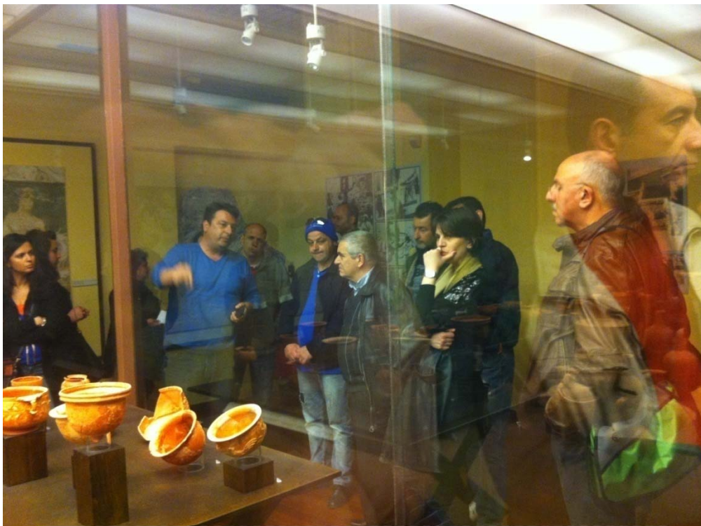
Εικ.3 : Επίσκεψη του ΣΔΕ και ξενάγηση στο Αρχαιολογικό Μουσείο Μυτιλήνης