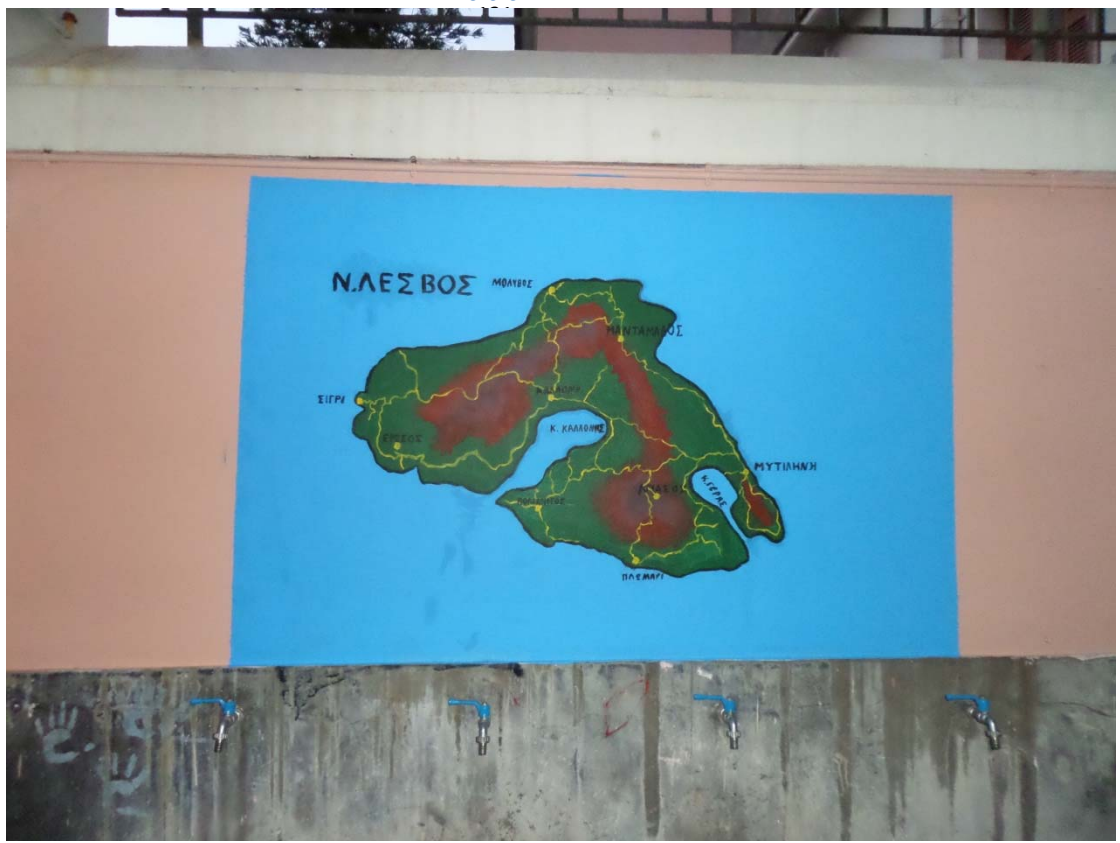
Εικ.4 : Αναπαράσταση της Λέσβου, φτιαγμένο από τους μαθητές