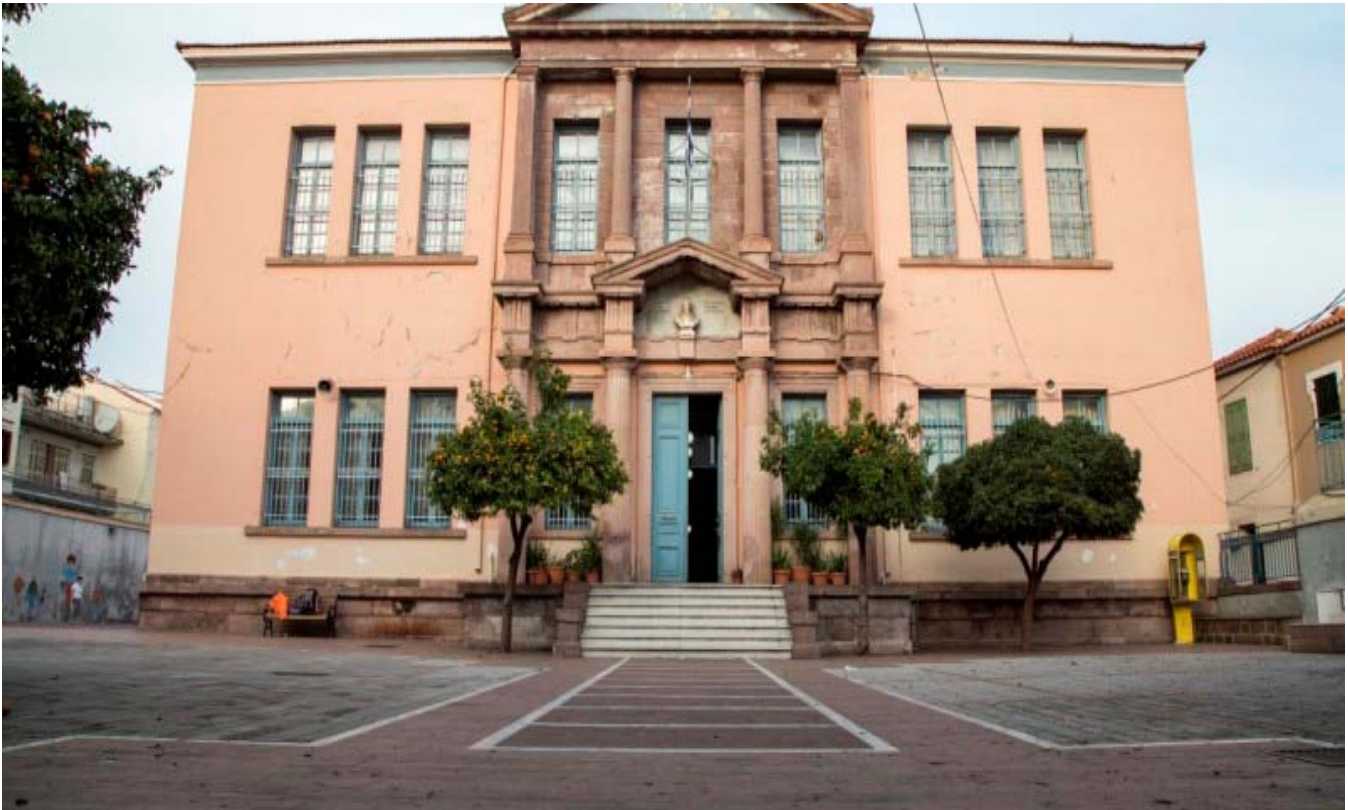
Εικ.1 : Η Πρόσοψη του ΣΔΕ Μυτιλήνης