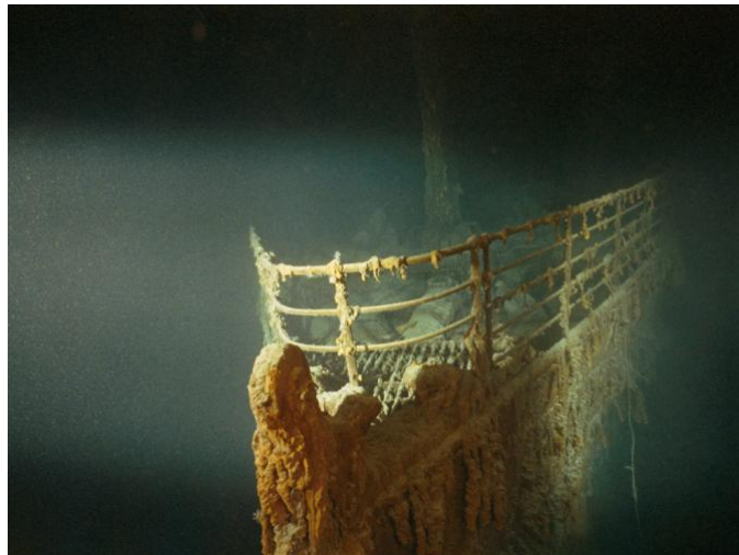
Το πλοίο RMS Τιτανικός κάτω από τα 3800 μέτρα νερού, 1912

ορθό πλαίσιο ανάπτυξής της στην Ελλάδα. Αξίζει να σημειωθεί ότι οι σπουδαίες προσπάθειες που έλαβαν χώρα στις ελληνικές θάλασσες, έφεραν κυριολεκτικά στην επιφάνεια αναρίθμητες μαρτυρίες της πολιτισμικής κληρονομιάς, υπό των υδάτων, της Ελλάδας, οι οποίες περίμεναν να έρθουν στο φως. Οι μαρτυρίες αυτές κατάφεραν να προσθέσουν στην ιστορική μας γνώση και να διευρύνουν τις ιστορικές, και όχι μόνο, γνώσεις του έθνους, ενώ ακόμα πλήθος ανεξερεύνητων άλλων παραμένει στον βυθό της θάλασσας.