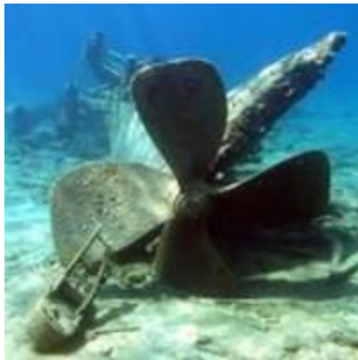
Το Εθνικό Θαλάσσιο Ιερό Thunder Bay, ΗΠΑ

υπολειπόμενα κηρυγμένα ενάλια αρχαιολογικά πάρκα, των οποίων οι περιπτώσεις θα μελετηθούν ως προς τον τρόπο λειτουργίας τους όσον αφορά τις πρακτικές αξιοποίησης και προστασίας τους.