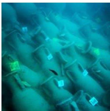
Αμφορείς του ναυαγίου Bou Ferrer

Στη συνέχεια, με τις εκστρατείες ανασκαφής του 2006 και του 2007, ήρθαν στο φως διακόσιοι τριάντα αμφορείς χωρίς ίχνος καταστροφής. Έπειτα, με την εκστρατεία εκσκαφής του 2012, η Γενική Διεύθυνση Πολιτισμικής Κληρονομιάς σε