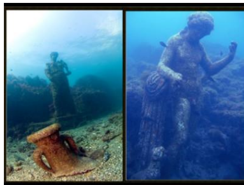
το Νυμφαίο του αυτοκράτορα Claudius

Η Μπάϊα ήταν αρχαία ρωμαϊκή πόλη που βρισκόταν στη βορειοδυτική ακτή του κόλπου της Νάπολης. Ήταν ένα μοντέρνο θέρετρο για αιώνες στην αρχαιότητα, ιδιαίτερα από το τέλος της Ρωμαϊκής Δημοκρατίας, το οποίο θεωρήθηκε ανώτερο μέρος αναφυχής από την Πομπηία και το Κάπρι. Ήταν ένα σημείο διακοπών για τα