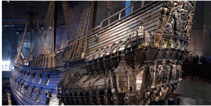
Το πολεμικό πλοίο Vasa βυθίστηκε στο αρχικό του ταξίδι στη μέση της Στοκχόλμης το 1628.

Στην περίπτωση του Μουσείου της Βάσας στη Σουηδία παρουσιάζεται το πολεμικό πλοίο Βάσα του 17 ου αιώνα, το οποίο ήταν το ισχυρότερο πλοίο που τότε είχε υπάρξει. Το πλοίο βυθίστηκε το 1628 και ανασύρθηκε από τη θάλασσα της Στοκχόλμης με εκατοντάδες ξύλινα γλυπτά το 1961. Με το άνοιγμα του Μουσείου το 1990, το πλοίο έγινε το επίκεντρο των θεματικών εκθεμάτων για όλες τις πτυχές της ναυτικής ζωής του 17 ου αιώνα και αποτελεί το πιο επισκέψιμο Μουσείο της Σκανδιναβίας (Vasa Museet, 2016).