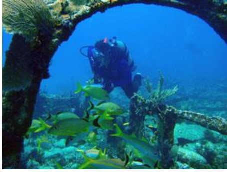
υποθαλάσσια επίσκεψη στο Florida Keys

καγιάκ κτλ., τα οποία συνεργάζονται με το Thunder Bay (Thunder Bay National Marine Sanctuary, 2017).