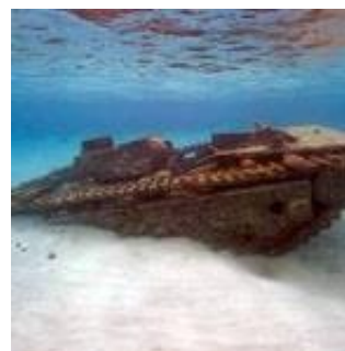
Ναυάγιο από τη μάχη του Σεϊπάν, 1944

Στη συνέχεια, το πάρκο WWII Maritime Heritage Trail, που βρίσκεται στην περιοχή του Σεϊπάν των Νήσων Βόρειων Μαριάνων στις ΗΠΑ, αποτελείται από μια συλλογή υποθαλάσσιας κληρονομιάς ιρακινών και αμερικάνικων ναυαγίων, οχημάτων επίθεσης και ναυαγίων αεροσκαφών της μάχης του Σεϊπάν του 1944. Το πάρκο έχει γίνει ένα δημοφιλές αξιοθέατο για κολυμβητές, ελεύθερους και αυτόνομους δύτες. Το εκάστοτε ναυάγιο έχει ερμηνευτεί και αποτυπωθεί σε υποβρύχιους καταδυτικούς οδηγούς πεδίου που είναι διαθέσιμοι για την επίσκεψη των ενδιαφερομένων. Οι περιοχές που έχουν ανακαλυφθεί ως τώρα είναι εννέα και επιτρέπεται σε όλες η πρόσβαση του κοινού. Οι επισκέψεις στο πάρκο διοργανώνονται, επίσης, από τα καταδυτικά κέντρα της περιοχής (WWII Maritime Heritage Trail, 2018).