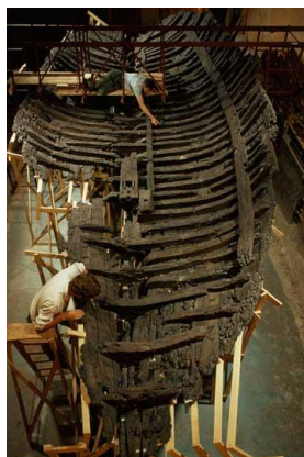
Ναύαγιο Κερύνειας

Επίσης, μια πολύ σημαντική ανασκαφή έγινε την περίοδο του 1967-1969 στο πρώιμο ελληνιστικό ναύαγιο της Κερύνειας στην Κύπρο υπό την επιστημονική ευθύνη του Αρχαιολογικού και Ανθρωπιστικού Μουσείου του Πανεπιστημίου της Pennsylvania. Το ναύαγιο ανελκύστηκε ολόκληρο και μετά από παραδειγματική συντήρηση, εκτέθηκε στο μεσαιωνικό φρούριο της Κερύνειας. Σήμερα εκτίθεται στον ίδιο χώρο, στα κατεχόμενα της Κύπρου, χωρίς την επιστημονική φροντίδα των κυπριακών αρχών και χωρίς τη συμμετοχή της ερευνητικής ομάδας που το ανέσκαψε.