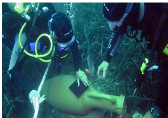
Αρχαιολογικά ευρήματα στην περιοχή της Acitrezza

Η Σικελία διαδραματίζει σημαντικό ρόλο στη μεσογειακή υποβρύχια αρχαιολογία χάρη στην ιστορία και την κληρονομιά της. Υπήρξε δημοφιλής χώρος στα παρελθόντα χρόνια για τους θαλασσινούς, είτε αυτοί μετέφεραν εμπόριο, είτε ήταν πειρατές και τυχοδιώκτες. Η Σικελία ήταν ένας τόπος όπου συγκεντρώνονταν διαφορετικοί πολιτισμοί, οι οποίοι αντάλλαζαν ιδέες και αγαθά. Οι ιστορικές μαρτυρίες της που βρίσκονται στο βυθό της θάλασσας έχουν βγει στην επιφάνεια τις τελευταίες δεκαετίες (Allard Pierson Museum, 2015).