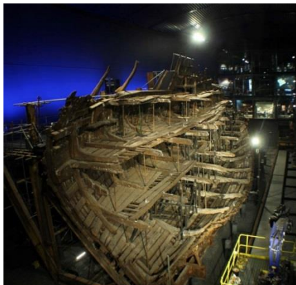
The Mary Rose 1511-1545 – Επιτυχημένο πολεμικό πλοίο του 16 ου αιώνα

Ένα άλλο αξιοσημείωτο παράδειγμα αποτελεί το Μουσείο Mary Rose του Ηνωμένου Βασιλείου. Στο μουσείο αυτό εμφανίζεται το πολεμικό πλοίο Mary Rose του 16 ου αιώνα, ένα από τα κυριότερα πλοία του στόλου του βασιλιά Ερρίκου VIII, μαζί με το ιστορικό του υπόβαθρο. Το πλοίο κατασκευάστηκε για να υπηρετήσει το αγγλικό ναυτικό Tudor, όπου μετά το τριακοστό τρίτο έτος (1545 μ.Χ.) επιτυχούς υπηρεσίας του βυθίστηκε κατά τη μάχη του Solent. Το τμήμα του πλοίου που έχει ανασυρθεί μαζί με τα χιλιάδες