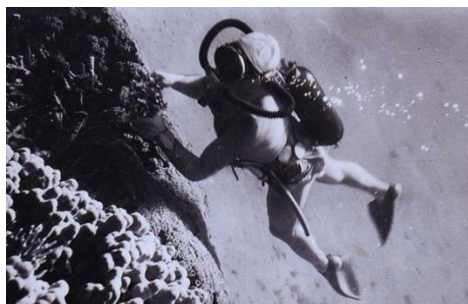
Συσκευή αυτόνομης κατάδυσης του Cousteau και της Gagnan, 1943

Η διερεύνηση της υποβρύχιας πολιτιστικής κληρονομιάς στην Ελλάδα μέχρι και τον Β' Παγκόσμιο Πόλεμο γινόταν από Αιγαιοπελαγίτες σφουγγαράδες με τις πρώτες καταδυτικές συσκευές, οι οποίες ήταν σκάφανδρα με μπρούτζινες περικεφαλαίες. Το 1943 ο Jacques-Yves Cousteau και η Emile Gagnan τελειοποίησαν τη συσκευή αυτόνομης κατάδυσης, η οποία λίγο καιρό μετά τέθηκε στην υπηρεσία της αρχαιολογίας. Η τελειοποίηση της συσκευής άνοιξε νέους ορίζοντες στην υποβρύχια αρχαιολογία, αφού στην ουσία γεννήθηκε από αυτήν, καθώς επίσης και στην εξερεύνηση του βυθού. Η Μεσόγειος και συγκεκριμένα η Ελλάδα ήταν από τους κυριότερους χώρους όπου επικεντρώθηκε εξ αρχής η έρευνα.