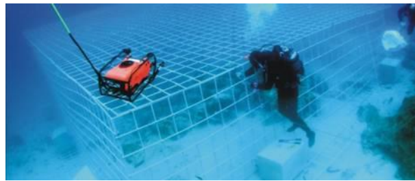
προστασία με μεταλλικούς κλωβούς στο Ενάλιο Αρχαιολογικό Πάρκο της Κροατίας

Επιπλέον, για τις βαθύτερες τοποθεσίες της περιοχής απαιτείται πρόσδεση των δυτών σε βυθισμένους σημαντήρες. Οι καταδυτικές δραστηριότητες πραγματοποιούνται από τα καταδυτικά κέντρα της