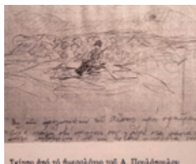
Σελίδα από το ημερολόγιο του Α. Πουλόπουλου