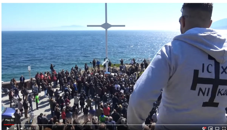
Αγιασμός Σταυρού στο Απελή Β ΜΕΡΟΣ

Χαρακτηριστική είναι η περίπτωση του σταυρού στο Απελή. Παραθαλάσσιο σημείο προσβάσιμο από τον περίγυρο του μεσαιωνικού κάστρου στο οποίο συχνάζει και έχει ιδιοποιηθεί μια άτυπη ομάδα χειμερινών κολυμβητών. Η θάλασσα έχει υπάρξει πολλαπλώς σημείο φόβου, διεκδίκησης και αποκλεισμού των αφροασιατών. Ανησυχίες για τον κίνδυνο εξάπλωσης ασθενειών. Δυσθυμίες για το ανδρικό βλέμμα των μουσουλμάνων. Απορία για τις (ελάχιστες) γυναίκες που κολυμπούν με τα ρούχα. Η εγκατάσταση ενός γύψινου σταυρού τον Σεπτέμβριο του 2018 πραγματοποιήθηκε ως απόδοση θρησκευτικής ταυτότητας και αποκλειστικότητας στον χώρο. Αντιδράσεις στον δημόσιο λόγο υπήρξαν άμεσες. Ακολούθησαν λεκτικές διαμάχες, ύβρεις και διαδικτυακές απειλές. Λίγες εβδομάδες αργότερα ο σταυρός αφαιρέθηκε από αγνώστους. Τον Μάρτιο του 2019 εν μία νυκτί τοποθετήθηκε νέος, με μέγεθος και βάρος τέτοιο ώστε να χρειαστεί βοήθεια γερανού στην εγκατάσταση του.