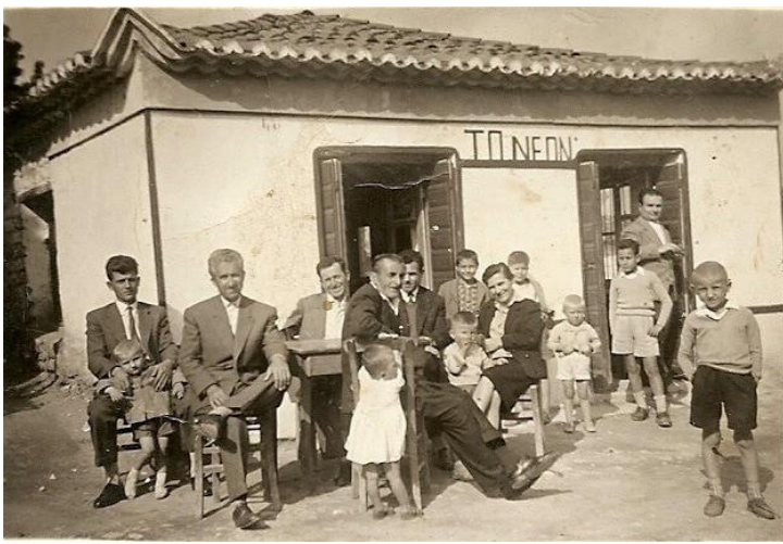
Εικόνα 6: Καφενείο «Το Νεον»