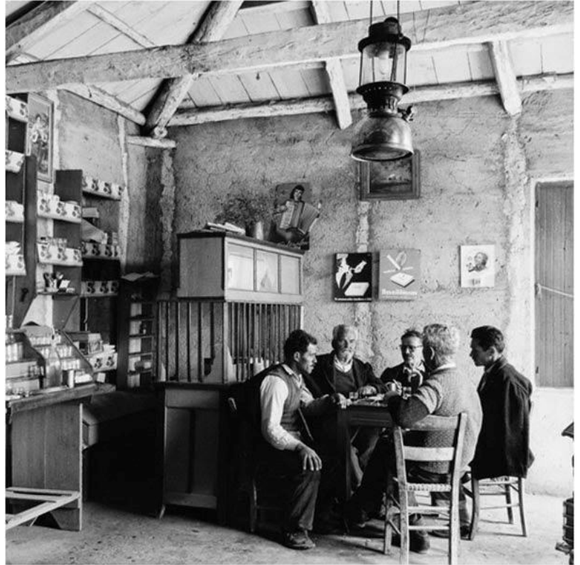
Εικόνα 5: Ελληνικό καφενείο