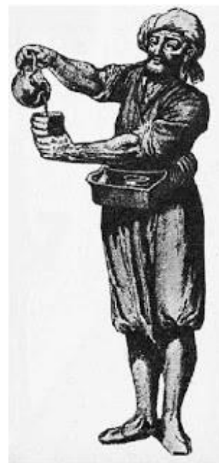
Εικόνα 7: Οθωμανός καφετζής

Στο Παρίσι, τα καφενεία έπαιξαν σπουδαιότατο ρόλο στην ιστορία της Γαλλίας κατά την εποχή της Επανάστασης. Πήγαιναν σ' αυτά οι αξιωματικοί των συμμαχικών στρατευμάτων που κατέλαβαν το Παρίσι αλλά και οι οπαδοί του Μεγάλου Ναπολέοντα. Από αυτές τις συναντήσεις προέκυπταν αιματηρές μονομαχίες. Ο Τούρκος πρέσβης