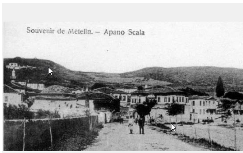
Εικόνα 11: Επάνω Σκάλα Μυτιλήνης

Ένας τέτοιος χώρος είναι και το ιστορικό καφενείο «Ερμής», ένα από τα πιο ιστορικά καφενεία του νησιού. Συγκεκριμένα, στην περιοχή της Επάνω Σκάλας, δηλαδή στο τέλος της κεντρικής εμπορικής οδού της Μυτιλήνης, την πολύβουη Ερμού, βρίσκεται το καφενείο Ερμής. Εκεί ήταν η παλιά τούρκικη γειτονιά του λιμανιού, όπου αναπτύχθηκε κάποτε η μουσουλμανική κοινότητα της πόλης. Σε αυτή την περιοχή έφτιαξε τα σπίτια της, έχτισε το τζαμί της (σώζεται χωρίς το μιναρέ) και το χαμάμ της, τα δημόσια τούρκικα λουτρά, και βέβαια εκεί που άνοιξε τους καφενέδες της, ένας από τους οποίους ήταν και ο «Ερμής».