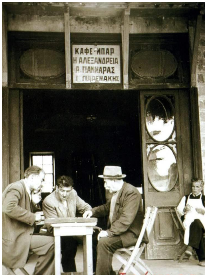
Εικόνα 8: Τα καφενεία της Αθήνας του 1900

Παρολα' αυτά και τα καφενεία της Ελληνικής επαρχίας ήταν μνημεία τέχνης και μας μεταφέρουν σήμερα σε άλλες εποχές. Το ίδιο και οι ιδιοκτήτες τους που διατηρούν το ήθος ενός κόσμου που χάνεται (Γιάννης, 2017).