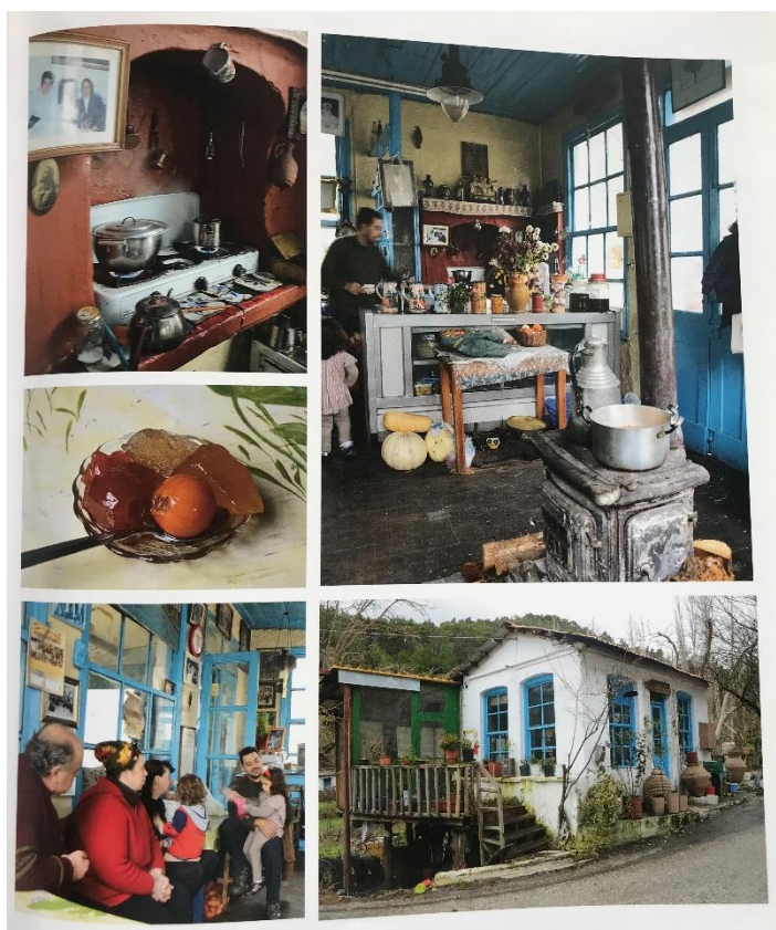
Εικόνα 9: Καφενείο Κυρα Ρήνης

Ο καθηγητής Γιώργος Νικολακάκης, ανάμεσα στα άλλα γράφει: «Τα καφενεία της Λέσβου έχουν χρώματα και αρώματα. Μυρουδιές του καφέ, των αφεψημάτων, των μεζέδων, της ξυλόσομπας και του κάρβουνου, του καπνού και των ανθρώπινων αναπνοών, στον στενό, περιορισμένο χώρο. Έχουν ενδιαφέροντες φωτεινούς και συχνά απρόσμενους συνδυασμούς χρωμάτων. Οι τοίχοι είναι βαμμένοι σε χρώμα “σκούρο άσπρο”, μπεζ, “άσπρο λερό”, που κάνει αδιόρατη την κάπνα. Τα ξύλινα μέρη τους, το τέμπλο, ο μπουφές, το ταβάνι, οι κορνίζες των παραθύρων, είναι βαμμένα καφετιά, ανοικτά πράσινα, κυταρισσιά, σε αποχρώσεις του μπλε, άσπρα ή υπόλευκα. Οι καρέκλες, τα ξύλινα μέρη των καναπέδων και των μαρμάρινων τραπεζιών, είναι συνήθως σκούρα. Κυριαρχεί το καφέ και το πράσινο το βαθύ». (Πίπτας Γ., 2014)