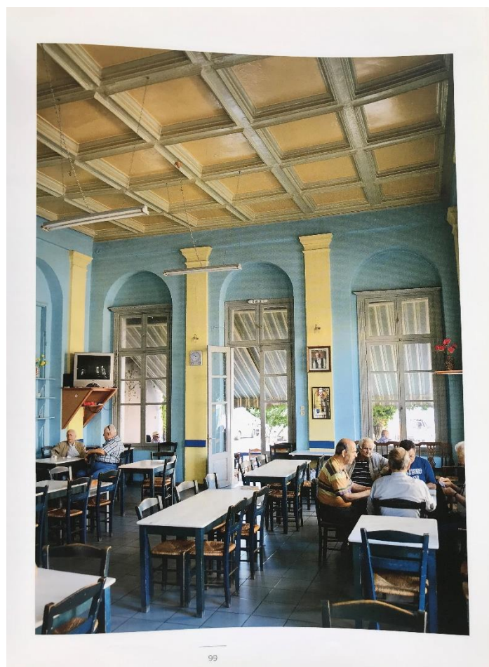
Εικόνα 10: Καφενείο «Η Καφενταρία»