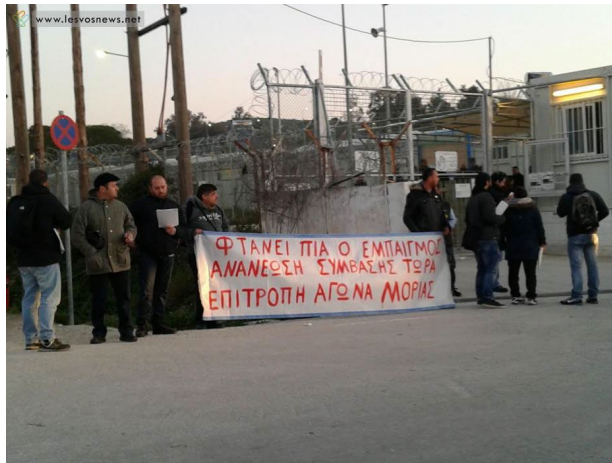
Εικ.10 Απεργία εργαζόμενων έξω από το κέντρο κράτησης «Μόρια»