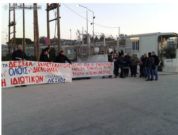
Εικ.9 Απεργία εργαζόμενων έξω από το κέντρο κράτησης «Μόρια»