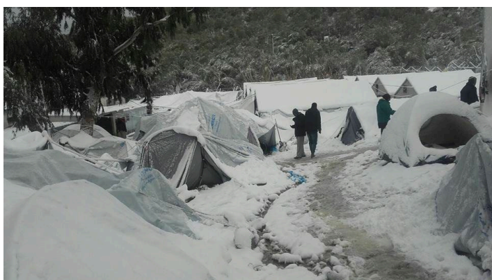
Εικ.7 Χειμερινή περίοδος 2016 «Μόρια»