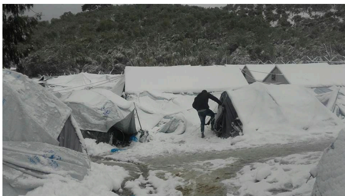
Εικ.8 Χειμερινή περίοδος 2016 «Μόρια»