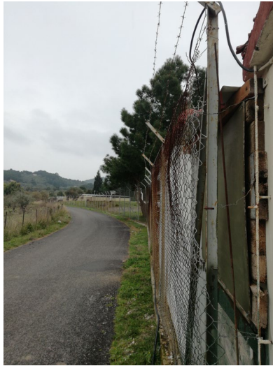
Εικ.5 Στρατόπεδο στη Μυτιλήνη