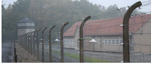
Εικ.4 Στρατόπεδο συγκέντρωσης Μπούχενβαλντ στη Γερμανία