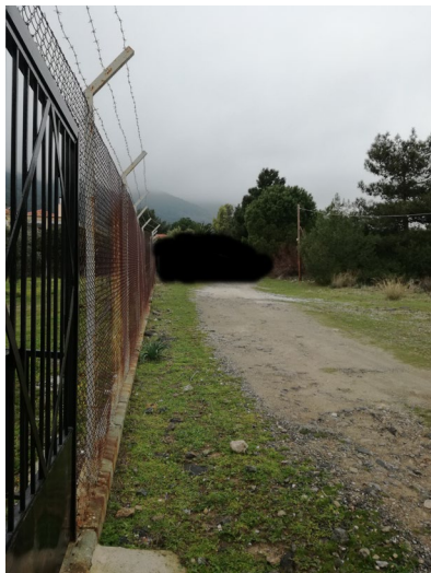
Εικ.6 Στρατόπεδο στη Μυτιλήνη