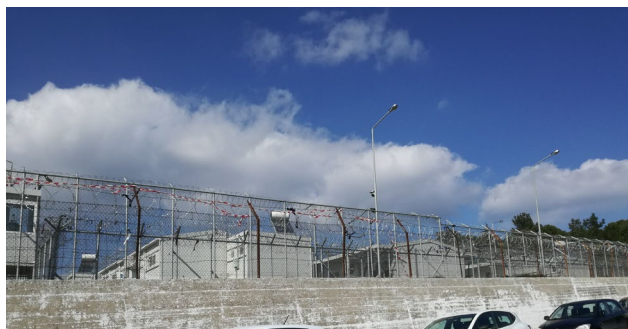
Εικ.3 Κέντρο κράτησης «Μόρια»