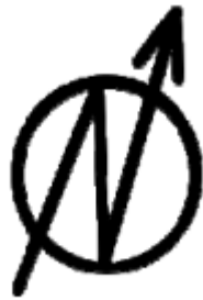
Εικόνα 1 : Το σύμβολο των Α.Κ.Κ. και μια αφίσα για τους Diggers.