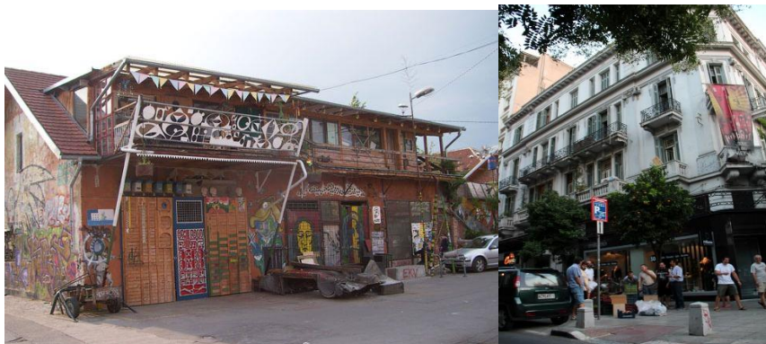
Εικόνα 2 : Α.Κ.Κ. σε Ελλάδα, Τσεχία, Ολλανδία και Σλοβενία.