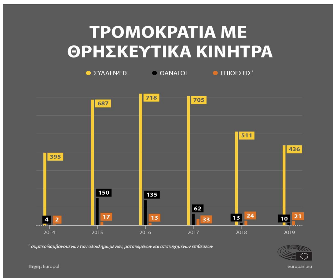
Εικόνα 2.3 Τρομοκρατία με θρησκευτικά κίνητρα

- η αξιοποίηση των ισλαμιστριών γυναικών, είτε ως μαχητριών (τζιχαντίστριες) είτε ως γυναικείας θρησκευτικής αστυνομίας (Χίσμπα), η οποία ελέγχει αν τηρούνται οι νόμοι της Σαρία, είτε ως «ερωτικών» τζιχαντιστριών οι οποίες θα παράγουν μελλοντικούς μαχητές 64 .