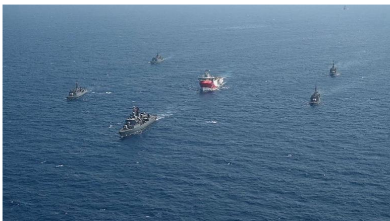
Εικόνα 8. Το σεισμογραφικό Oruç Reis συνοδευόμενο από τουρκικό στολίσκο πολεμικών πλοίων πλέει προς τη δεσμευμένη με NAVTEX περιοχή νότια του Καστελόριζου το καλοκαίρι του 2020

Η τουρκική εξωτερική πολιτική στην ευρύτερη περιοχή της Ανατολικής Μεσογείου, έχει περάσει από τη θέση «μηδενικά προβλήματα με τους γείτονες» 3 που διακήρυττε η κυβέρνηση του ΑΚΡ στο πρώιμο στάδιο της διακυβέρνησής της στο εντελώς αντίθετο. Τα ήδη υπάρχοντα