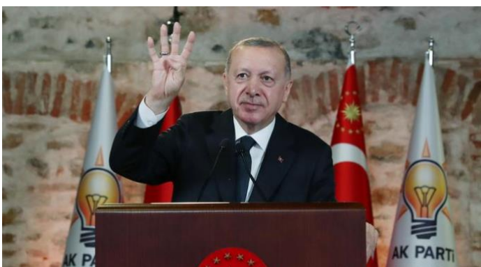
Εικόνα 1. Ο Τούρκος πρόεδρος Ερντογάν σε ομιλία του σχηματίζει τον χαιρετισμό «ραμπιά»

Ο Τούρκος πρόεδρος αρέσκεται στο να παρουσιάζει τον εαυτό του ως παγκόσμιο ηγέτη του Ισλάμ (Μελέτης, 2020). Αν και στην αρχή, η θρησκευτική αυτή διάσταση φάνηκε να βοηθάει την τουρκική κυβέρνηση στο να κερδίσει τη δυτική υποστήριξη μέσω της εικόνας ενός μετριοπαθούς Ισλάμ, πρότυπου για τον εκδημοκρατισμό και των υπόλοιπων μουσουλμανικών