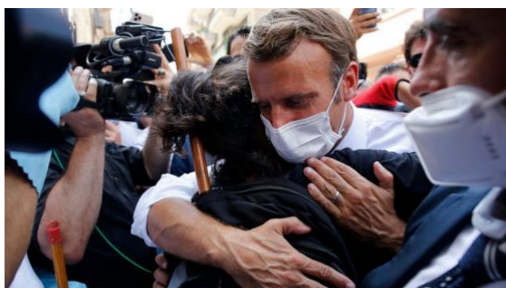
Εικόνα 6. Ο πρόεδρος Μακρόν στην επίσκεψή του στον Λίβανο μετά την καταστροφική έκρηξη στο λιμάνι της Βηρυτού επιβεβαιώνει στους κατοίκους της πόλης ότι η Γαλλία δεν τους ξεχνάει

Ο ανταγωνισμός μεταξύ Γαλλίας και Τουρκίας εξελίσσεται και σε ένα νέο μέτωπο, το οποίο μέχρι στιγμής έχει παραμείνει μακριά από τα φώτα της δημοσιότητας, τον Λίβανο. Η τουρκική ηγεσία ήταν βαθιά απογοητευμένη από την ένθερμη υποστήριξη προς τον Γάλλο