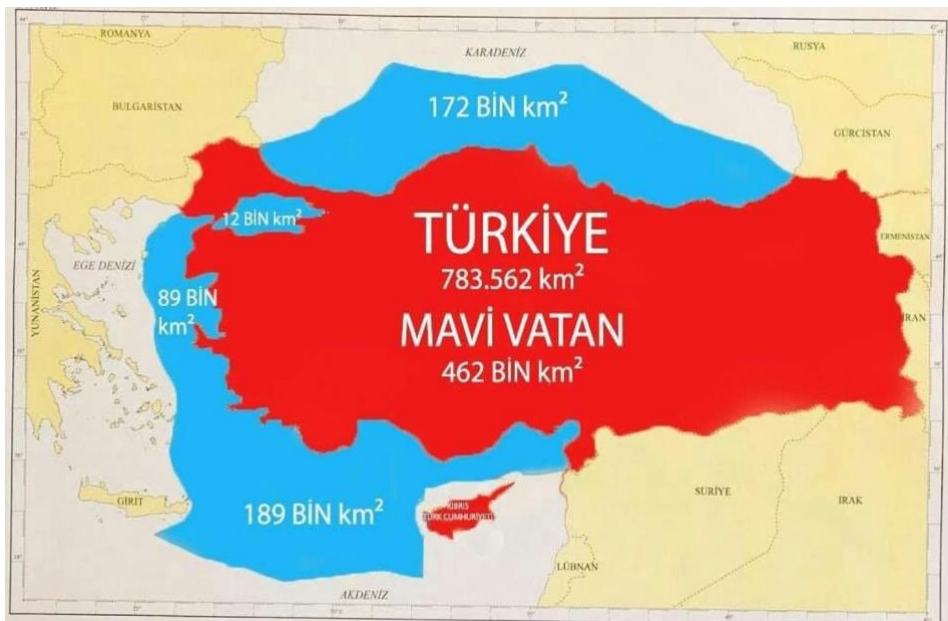
Εικόνα 2. Ο χάρτης της "Γαλάζιας Πατρίδας"

Η έννοια της «Mavi Vatan» εκφράστηκε με συγκεκριμένες γεωγραφικές διαστάσεις, και πιο συγκεκριμένα με ένα όραμα διεύρυνσης των τουρκικών θαλάσσιων ορίων σε μια έκταση 462.000 τετραγωνικών μέτρων (βλ. Εικόνα 2 ), και με αποφασιστικότητα υπεράσπισής τους με