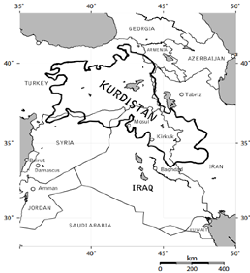
Map of the area inhabited by Kurds