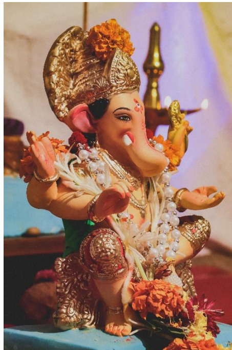
Εικόνα 1.2 Γκανέσα (Ganesh) 2

• Ο βραχμανισμός/ Ινδουισμός είναι ο πανθεϊσμός, δηλαδή ο άνθρωπος προσπαθεί να γίνει η καλύτερη εκδοχή του εαυτού του συνδυάζοντας τη ζωή του με το βράχμα, « την πιο μεγάλη δύναμη από την οποία ξεκινούν όλα αλλά και σταματούν» (Γαλανοπούλου, 2022). Δεν αποτελεί μια ενιαία θρησκεία, αλλά σύνολο παραδόσεων που αναπτύχθηκαν γύρω από την κοιλάδα του Ινδού ποταμού. Μια από τις πιο γνωστές αναπαραστάσεις θεότητας στον Ινδουισμό είναι ο Γκανέσα, ο θεός με το κεφάλι ελέφαντα.