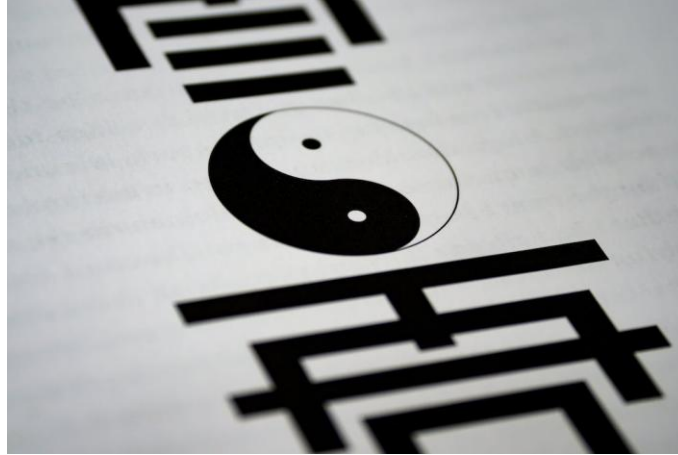
Εικόνα 1.4 Γιν Γιανγκ (Ying – Yang) 5

• Ο σιντοϊσμός είναι ιαπωνική θρησκεία που εμφανίστηκε τον 6 ο αιώνα, και για ένα διάστημα, μάλιστα, αποτελούσε την κρατική της θρησκεία (Γερμαντζίδου, 2021). Η θρησκεία αυτή συνδέεται με τη λατρεία των κάμι, ιαπωνικός όρος που σημαίνει θεός, θεότητα ή πνεύμα (Γερμαντζίδου, 2021). Ο σιντοϊσμός είναι μια από τις αρχαιότερες θρησκείες, ενώ εκφράζεται ως ανιμισμός και ως πολυθεϊα (Γερμαντζίδου, 2021). Το ιερό όρος Φούτζι (Fuji) αποτελεί το πιο ιερό σημείο της Ιαπωνίας.