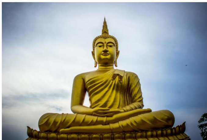
Εικόνα 1.3 Χρυσός Βούδας 4

• Ο κομφουκιανισμός, δημοφιλής θρησκεία στην Κίνα, βασίζεται στη διδασκαλία του Κομφούκιου, Κινέζου διανοητή και κοινωνικού φιλοσόφου. Οι διδασκαλίες του είναι συγκεντρωμένες στα Ανάλεκτα (Λούν Γύ), δηλαδή μια συλλογή από σκέψεις και απαντήσεις του (Αναστασίου αρχιεπισκόπου Αλβανίας. Η Θρησκεία του Κομφούκιου , Ι.Ν. Αγίου Σώστη Νέας Σμύρνης). 3