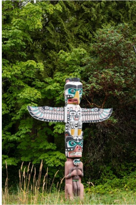
Εικόνα 1.1 Τοτέμ 1

«μυστικισμό» (Γιαλκέτσης, 2019). Η θρησκεία, λοιπόν, χωρίζεται σε πολλά είδη όπως σε φυσικές και αποκεκαλυμμένες, σε πολυθεϊστικές και μονοθεϊστικές θρησκείες. Οι φυσικές θρησκείες είναι οι θρησκείες που δημιούργησε ο άνθρωπος χρησιμοποιώντας τη φαντασία του και τις πνευματικές δεξιότητές του, όπως π.χ. η ειδωλολατρία (Σοφού, 2018). Η ειδωλολατρία περιέχει τον τοτεμισμό, ο οποίος σχετίζεται με τα έθιμα που έχουν σχέση με το τοτέμ, το οποίο περιγράφει κάθε αντικείμενο, ζώο ή φυτό, για το οποίο υπάρχει η αντίληψη ότι έχει ιερές ιδιότητες και γι' αυτό θεωρείται προστάτης της φυλής (Γαλανοπούλου, 2022).