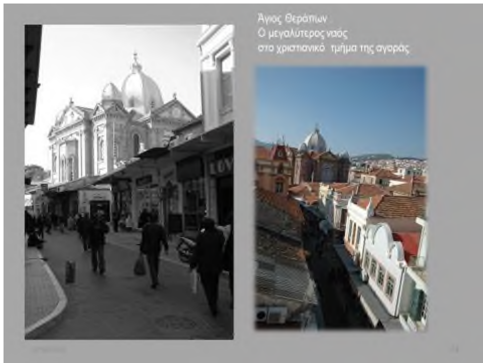
Εικόνα 5: Αρχείο Σ. Φραντζέσκου