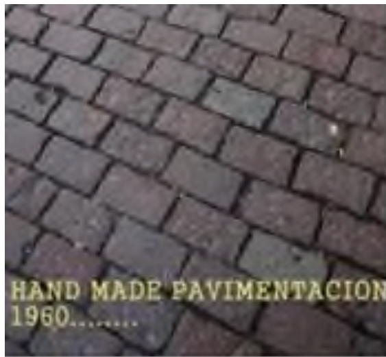
Εικόνα 16: Το παλιό πλακόστρωτο της αγοράς το 1960.