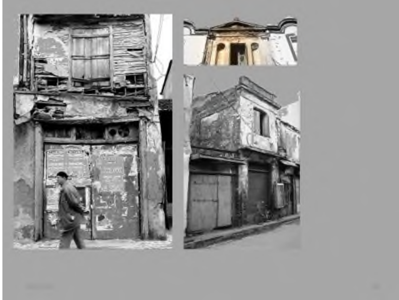
Εικόνα 14: Οι ξύλινες κατασκευές των κτιρίων στην αγορά στη τουρκική πλευρά της Παλιάς Αγοράς.

The grant coffee shop Panellinion. -photo after the second war mondiale.