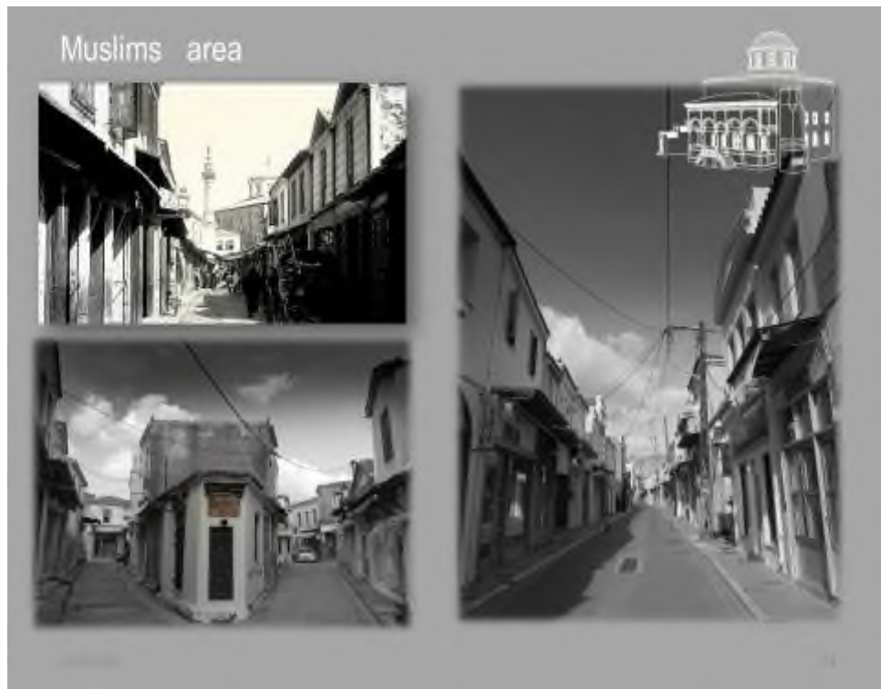
Εικόνα 3: Αρχείο Σ. Φραντζέσκου