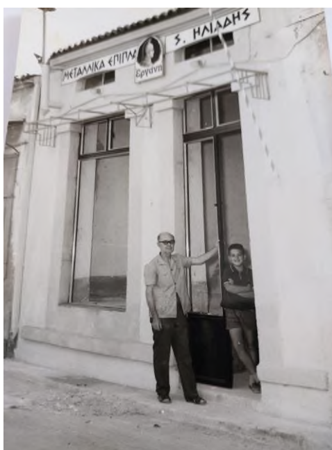
Εικόνα 10: Μεταλλικά έπιπλα Ηλιάδης

ξεκινώντας από τη δεκαετία του '50. Η ταξική διαστρωμάτωση είναι εμφανής, μιας που υπήρχε μια αστική τάξη που κουβαλούσε το «παλιό χρήμα» και τις αστικές συνήθειες. Η παλιά ευημερία και η αστική ανάπτυξη είναι αποτυπωμένη στον οικιστικό χώρο της πόλης και της αγοράς. Όμως η άνοδος της μεσαίας τάξης, που είναι υπό διαμόρφωση, όσον αφορά στην οικιακή και κοινωνική της κατάσταση, αποτυπώνεται καθαρά στο χώρο αυτό, μέσω των νέων καταναλωτικών συνήθειων των ανθρώπων που αλληλεπιδρούν στο χώρο, αλλά και από τα νέα ήθη που επιβάλλονται από τη νέα εποχή.