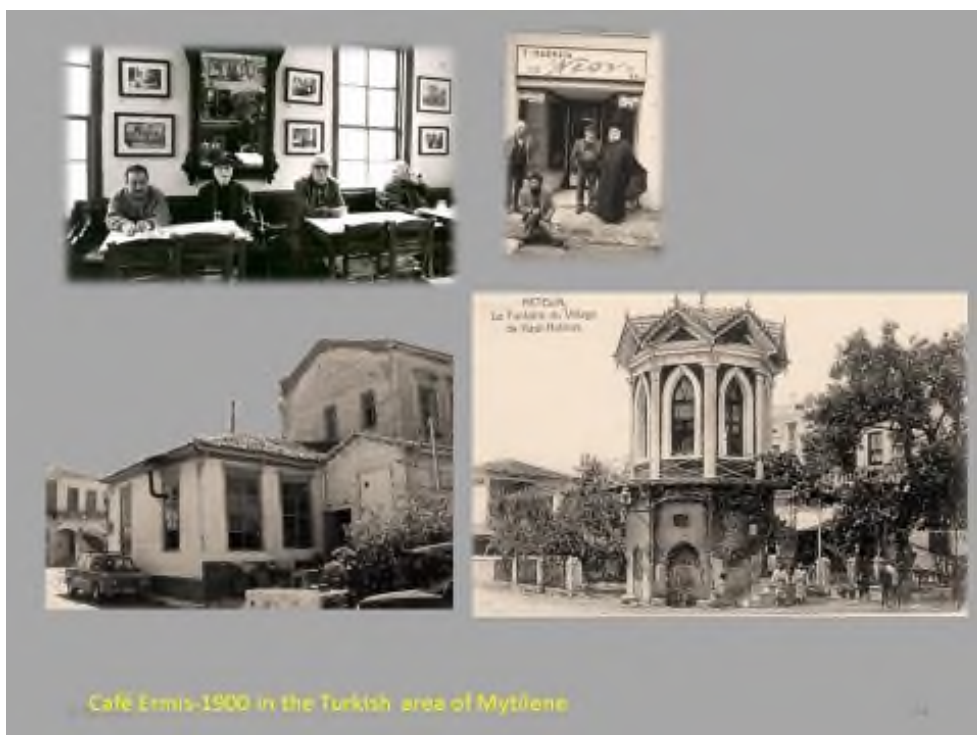
Εικόνα 6: Καφενείον «Ερμής» το 1900 και αντίστοιχα το 2000