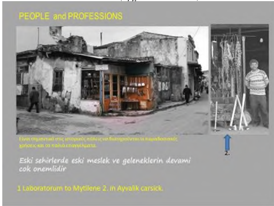
Εικόνα 12: Διαφάνεια που προβλήθηκε στο συνέδριο, που πραγματοποιήθηκε στο Αϊβαλί το 2015, για την ιστορική και πολιτισμική κληρονομιά της γειτονικής αυτής πόλης

Κάποτε στην Κουμιδιά: "ακουίζου μαχαίρια, ξουράφια, τσακέλια..."