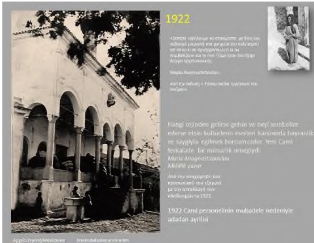
Εικόνα 4: Αρχείο Σ. Μπαλάσκα