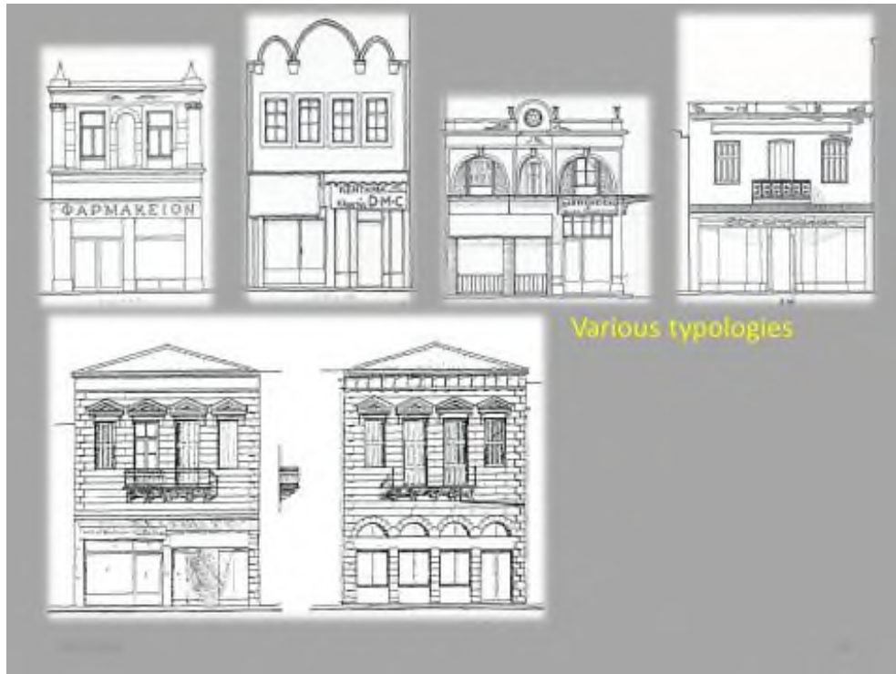
Εικόνες 8 και 9: Διαφάνειες που προβλήθηκαν στο συνέδριο, που πραγματοποιήθηκε στο Αϊβαλί το 2015, για την ιστορική και πολιτισμική κληρονομιά της γειτονικής αυτής πόλης