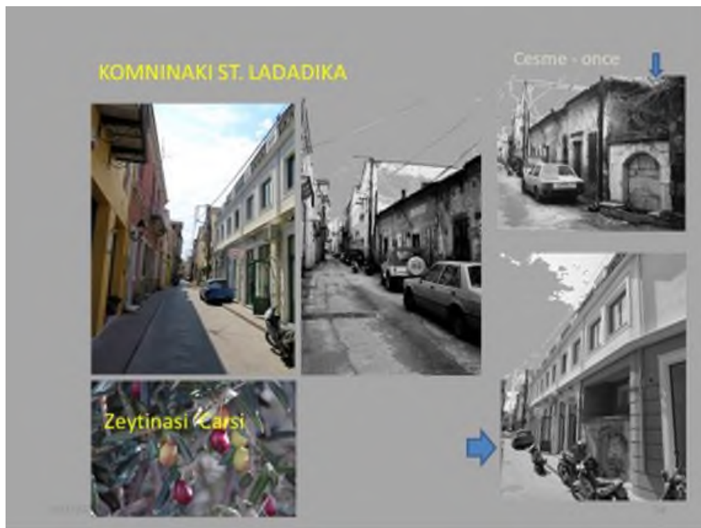
Εικόνα 17: Οδός Κομνηνάκη, Λαδάδικα.