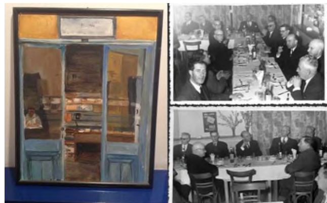
Εικόνα 1: Ελαιομεικτικό Τζοάννου τη δεκαετία του 1960

Το εργοστάσιο Καλαμάρη ιδρύθηκε το 1880, στο παλιό λιμάνι στη βόρεια πλευρά της πόλης της Μυτιλήνης, σε μια περίοδο ακμής για το νησί. Ήταν μοναδικό, γιατί συνδύαζε στο ίδιο συγκρότημα την επεξεργασία αλεύρων, βαμβακιού και νημάτων, με μακαρονοποιεία για κύριες εμπορικές χρήσεις, αλλά και ελαιοτριβείο και ξυλουργείο. Σταμάτησε να λειτουργεί το 1990, ενώ το 1993 το κτίριο της βιομηχανίας χαρακτηρίστηκε ως διατηρητέο (Αντωνιάδης, 2007).