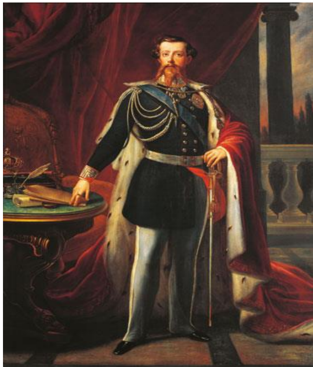
Ο Vittorio Emanuele ο βασιλιάς της Ιταλίας

Γεγονός το οποίο υποδηλώνει ότι το νέο κράτος αποτελεί μία επέκταση του παλιού Πιεμόντε, είναι ότι παρέμεινε στην εξουσία ως Βασιλιάς ο Βιττόριο Εμμανουέλε Β΄. Οι νόμοι, οι θεσμοί, οι υπάλληλοι και το σύνολο των κρατικών λειτουργιών σχετίζονταν με το Πιεμόντε. Η νέα κυβέρνηση προσδιόριζε τον διορισμό αρχηγών οι οποίοι προορίζονταν για την επαρχιακή διοίκηση, καθώς επίσης για την τοπική αυτοδιοίκηση εξυπηρετώντας με τον κάθε δυνατό τρόπο τις επιδιώξεις του Στέμματος. Το διοικητικό σύστημα του Πιεμόντε και οι