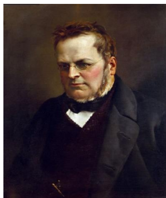
Camillo Benso Cavour