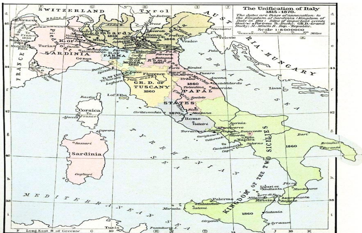
Η ιταλική ενοποίηση 1815-1870

διόρισε ως πρωθυπουργό του τον Ουρμπάνο Ρατάτσι. Ο τελευταίος έθεσε ως σκοπό του να επαναλάβει την στρατηγική που εφάρμοξε ο πρώην πρωθυπουργός δίνοντας έμφαση στο στράτευμα προκειμένου να εξασφαλίσει έδαφος πρόσφορο για την διενέργεια σκοπιμοτήτων που αφορούσαν την πόλη της Ρώμης και της Βενετίας.