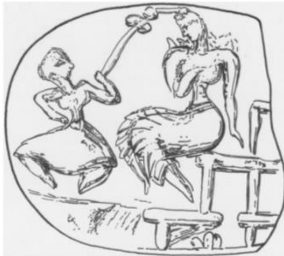
Εικόνα 5: Σφράγισμα με απεικόνιση προσφοράς σε θεότητα, Χανιά. (Rehak 2007, fig. 11.9.)