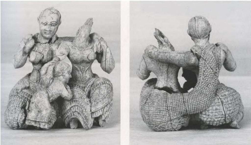
Εικόνα 1: «Ελεφαντοστέινη Τριάδα», Μυκήνες (ΥΜ Ι) Εθνικό Αρχαιολογικό Μουσείο Αθηνών. (Rutter 2003, fig. 11)