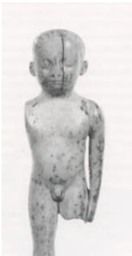
Εικόνα 9: Ελεφαντοστέινο ειδώλιο αγοριού, Παλάικαστρο (ΥΜ Ιβ) Αρχαιολογικό Μουσείο Ηρακλείου. (Rutter 2003, fig. 9)