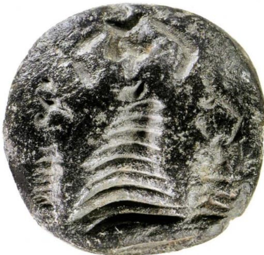
Εικόνα 6: Σφραγιδόλιθος με απεικόνιση γυναίκας πλαισιωμένης από δυο κορίτσια, Μόχλος (περίπου 1700-1450 π.Χ.)