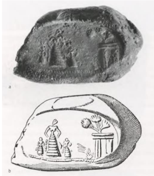
Εικόνα 4: Σφράγισμα απεικόνιση γυναίκας πλαισιωμένης από δύο κορίτσια, Αγία Τριάδα (ΥΜ Ιβ) Αρχαιολογικό μουσείο Ηρακλείου. (Rutter 2003, fig. 18)